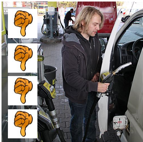
NICHT IN DEN INNENRAUM!!!

Dann muss die FAHRERIN/ der FAHRER den DIESEL-ZAPFHAHN aus seiner Öffnung der ZAPFSÄULE nehmen und in den EINFÜLLSTUTZEN einführen.