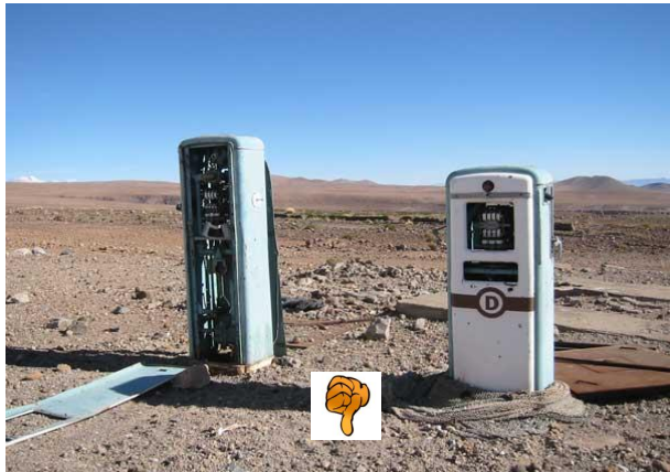
Nicht so ganz handelsübliche Tankstelle

Und zwar fährt er/sie an eine der dort meist oft vorkommenden ZAPFSÄULEN .