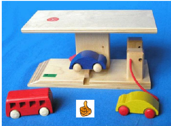
Eine handelsübliche Tankstelle

ältere Dominosteine, Spielgeld, Rabattmarken, Gutscheine für eine Freifahrt mit der Liliputbahn im Prater oder Ähnliches. ( Was ist ein ÄHNLICH? )