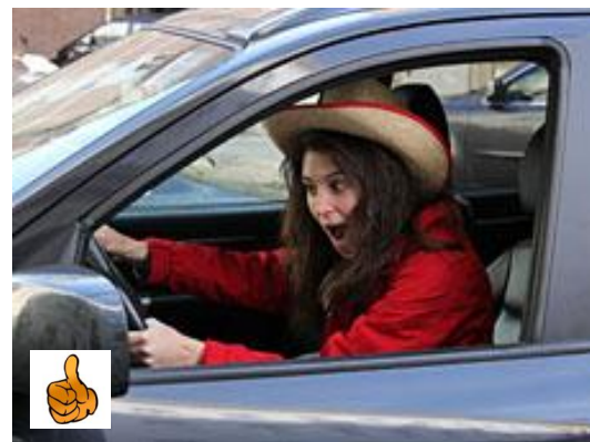
So sollte es nach dem Betreten aussehen!