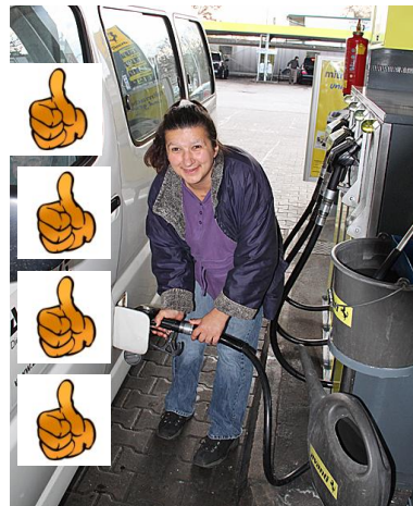
Gott sei Dank gibt es KlientInnen!!!

Das Ende des Tankvorganges kündigt sich durch ein metallisches KNACKEN im DIESEL-ZAPFHAHN an. ( Was ist ein KNACKEN? ) Danach zieht die FAHRERIN/ der FAHRER den DIESEL-ZAPFHAHN wieder aus dem EINFÜLLSTUTZEN und steckt ihn zurück in die dafür vorgesehene ÖFFNUNG der ZAPFSÄULE . ( Was ist eine ÖFFNUNG? )