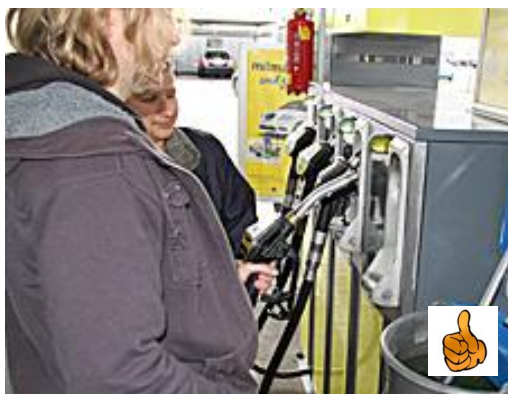
Der Zapfhahnzurücksteckvorgang 01

Das Ende des Tankvorganges kündigt sich durch ein metallisches KNACKEN im DIESEL-ZAPFHAHN an. ( Was ist ein KNACKEN? ) Danach zieht die FAHRERIN/ der FAHRER den DIESEL-ZAPFHAHN wieder aus dem EINFÜLLSTUTZEN und steckt ihn zurück in die dafür vorgesehene ÖFFNUNG der ZAPFSÄULE . ( Was ist eine ÖFFNUNG? )