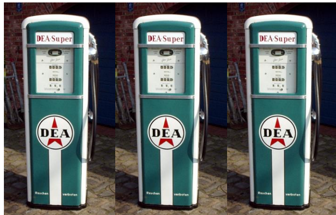
Oft vorkommende Zapfsäulen

ACHTUNG: die FAHRERIN oder der FAHRER müssen darauf achten, dass einer der in diesen ZAPFSÄULEN eingehängten ZAPFHÄHNE mit DIESEL bezeichnet ist!!!