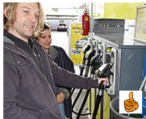
Der Zapfhahnzurücksteckvorgang 02

(WICHTIG: den DIESEL-ZAPFHAHN nicht mitnehmen oder in den Bus legen; das wird meist nicht so gerne gesehen. Ausserdem sind die daran befindlichen Schläuche nicht allzu lang ...)