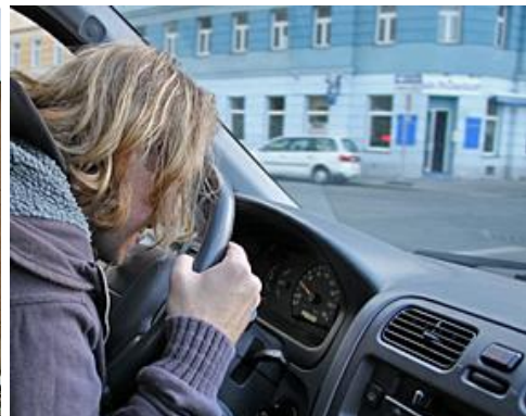
Juhu, der Tank ist voll ...