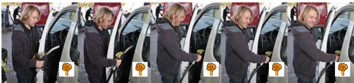
Das wird nicht ganz so gerne gesehen ...

(WICHTIG: den DIESEL-ZAPFHAHN nicht mitnehmen oder in den Bus legen; das wird meist nicht so gerne gesehen. Ausserdem sind die daran befindlichen Schläuche nicht allzu lang ...)