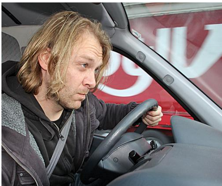
Ein entspannter Fahrer

Dann kann die FAHRERIN/ der FAHRER den AUFTAKT-BUS wieder zu seinem angestammten Platz in der ZENTRALE zurückbringen,