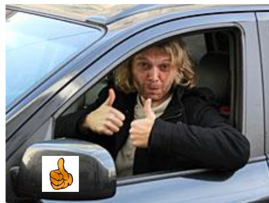
So sollte es nach dem Betreten aussehen!

(WICHTIG: es darf immer nur EINE/EINER fahren, gleichzeitig geht das nicht.)