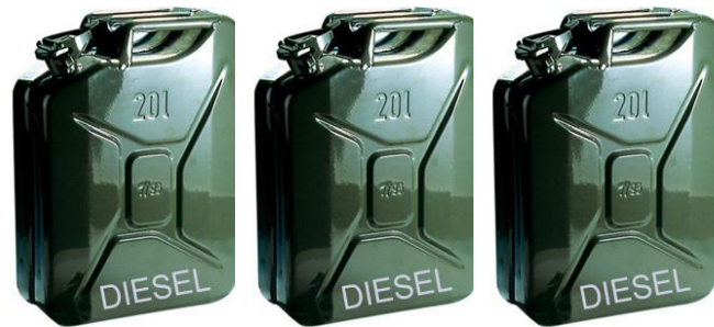
Soviel fasst ungefähr der Tank eines AUFTAKT-Busses

Je mehr Menschen mit dem Auftakt-BUS von hier nach dort gebracht werden und meistens auch wieder zurück und je größer die Entfernung zwischen dem hier und dort ist, desto mehr DIESELKRAFTSTOFF verbraucht der Auftakt-BUS .