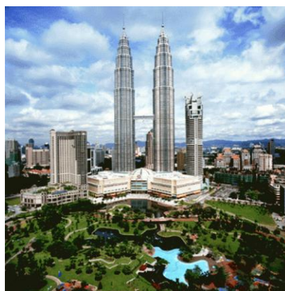
Kuala Lumpur ( Was ist ein KUALA LUMPUR? )

Neueste langjährige wissenschaftliche Feldstudien der Universität Kuala Lumpur